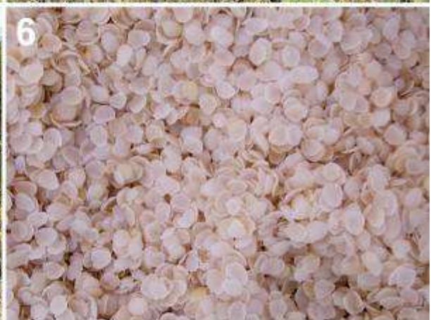
1) Frutos de tara cosechados; 2) Frutos de tara en planta; 3) Flores; 4) Hábito; 5) Hábitat (matorral espinoso) en Ayacucho; 6) Hojuelas.